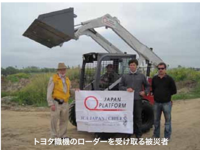
トヨタ織機のローダーを受け取る被災者