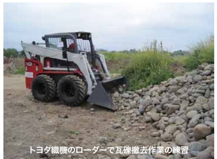
トヨタ織機のローダーで瓦礫撤去作業の練習