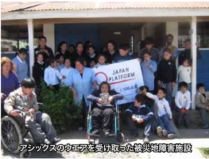
アシックスのウエアを受け取った被災地障害施設