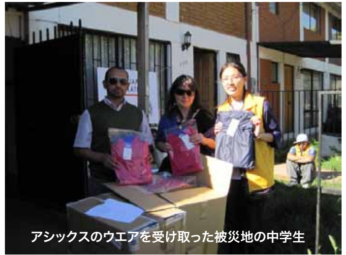
アシックスのウエアを受け取った被災地の中学生