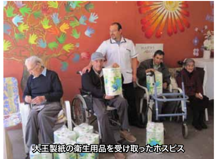
大王製紙の衛生用品を受け取ったホスピス