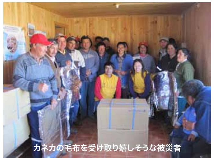
カネカの毛布を受け取り嬉しそうな被災者