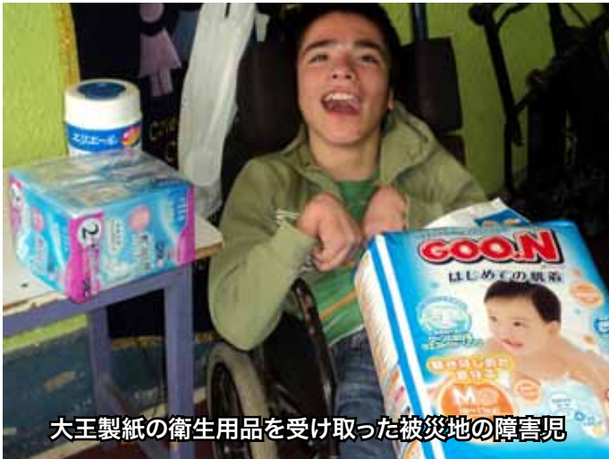
大王製紙の衛生用品を受け取った被災地の障害児