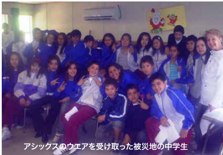
アシックスのウエアを受け取った被災地の中学生

2010年2月27日に発生したマグネチュード8.8の地震は死者800人以上、身元が確認されたのは279人のみである。地震の大きさとしては、世界で5番目に大きな地震である。地震発生20分後に津波が到着したが、海軍のミスで警報が遅れ、死者の大半の500人は津波による犠牲者となったと見られる。